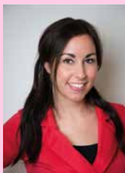
Moranni te Winkel